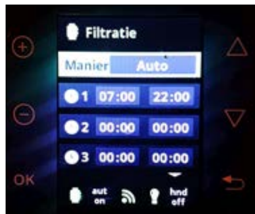
Navigeren met ▾ naar helemaal onderaan: 'Schoonmaken filter/ Backwash'