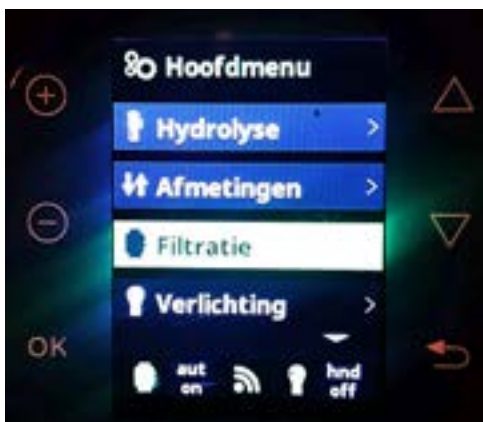
Kies 'Filtratie' en klik OK