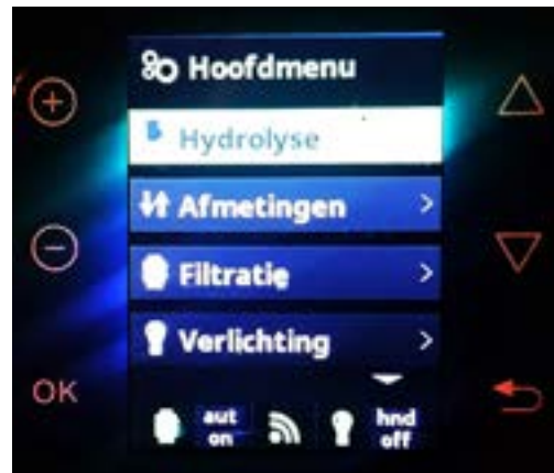
Navigeren met ▾ naar 'Filtratie'